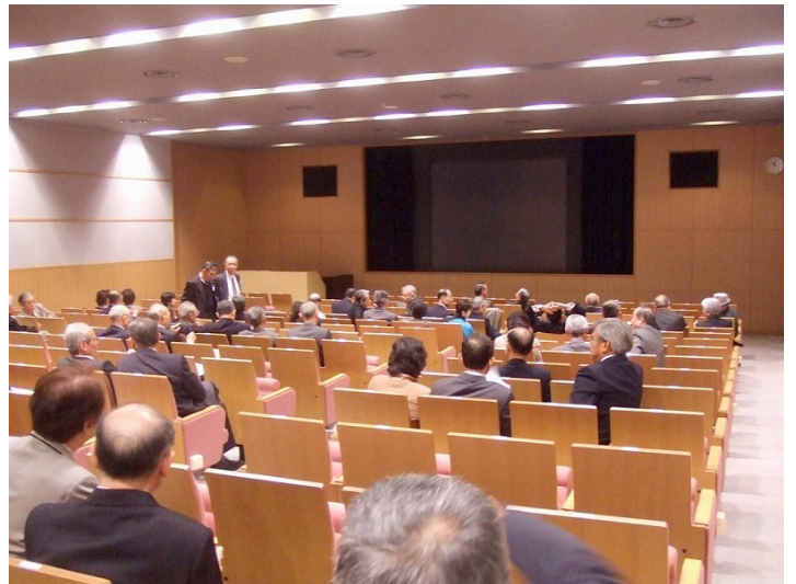
式場に隣接するビデオルーム