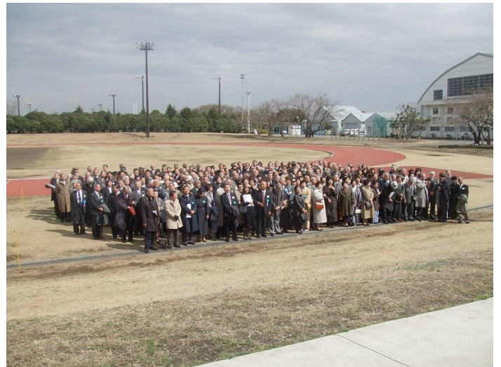
HCD参加者全員での記念撮影