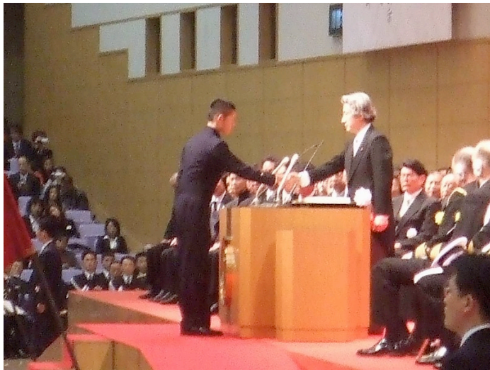
宣誓後握手する首相と卒業生