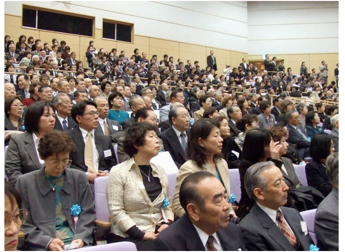
熱心に聞き入る7期生