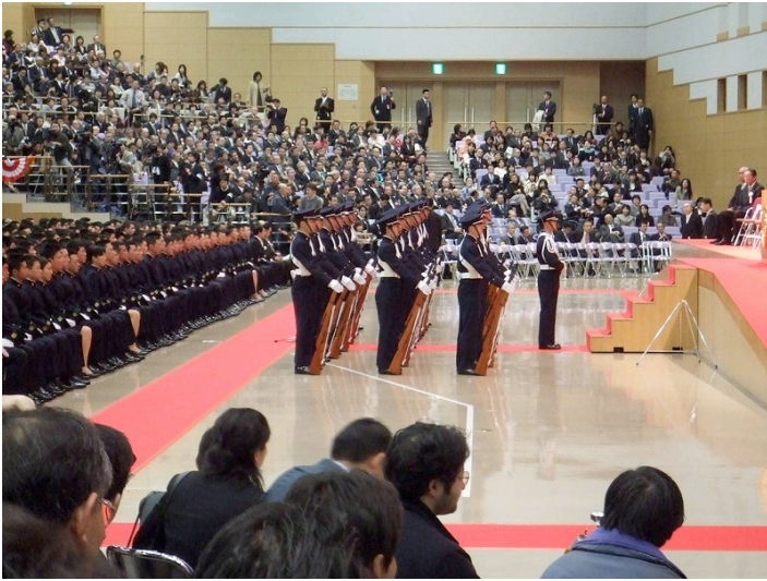
整列する儀杖隊と学生