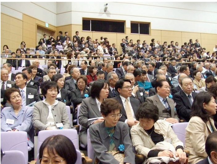
ご家族も式場内に参列