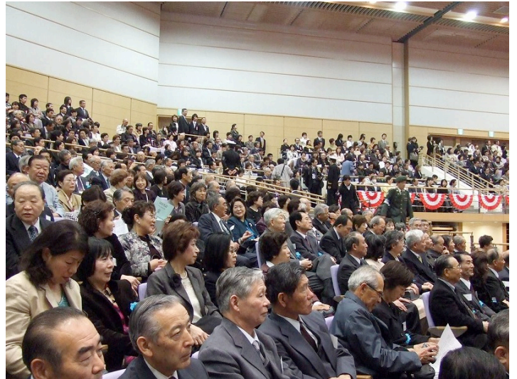
式場内に参列した7期生