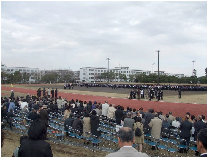
観閲式、学生・卒業生・HCD参加者が直線に